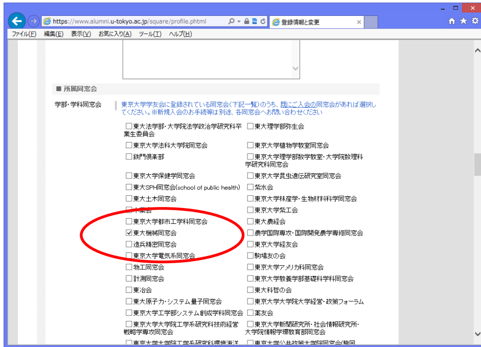
「登録情報と変更」の画面

2、所属同窓会への情報開示を指定⇒「開示」とすることにより、住所等の情報変更は自動的に機械同窓会のシステムに反映されますので、機械同窓会への情報変更のご連絡は不要となります。